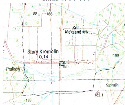
szkic lokalizacji skala 1: 50 000

Poswiadcza się, że niniejszy dokument został opracowany w wyniku prac geodezyjnych i kartograficznych, których rezultaty zawiera operat techniczny wpisany do ewidencji materiałów państwowego zasobu geodezyjnego i kartograficznego STAROSTA ZDUŃSKOWOLSKI organ prowadzący państwowy zasób geodezyjny i kartograficzny P.1019, 2017 1090 2017 -09- 0 1 (identyfikator ewidencyjny materiału zasobu - operatu technicznego) (data wpisania operatu technicznego do ewidencji) Z up. STAROSTY Anna Szewczyk INSPEKTOR BIURO GEODEZYJNO-KARTOGRAFII I KATASTRU